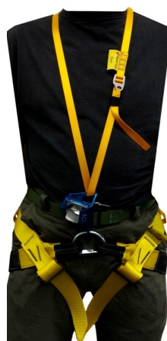
PICTURE 2 / FIGURA 2: Chest sling passed through the chest ascender and vested. / Fita Chest passada pelo bloqueante ventral e vestida.